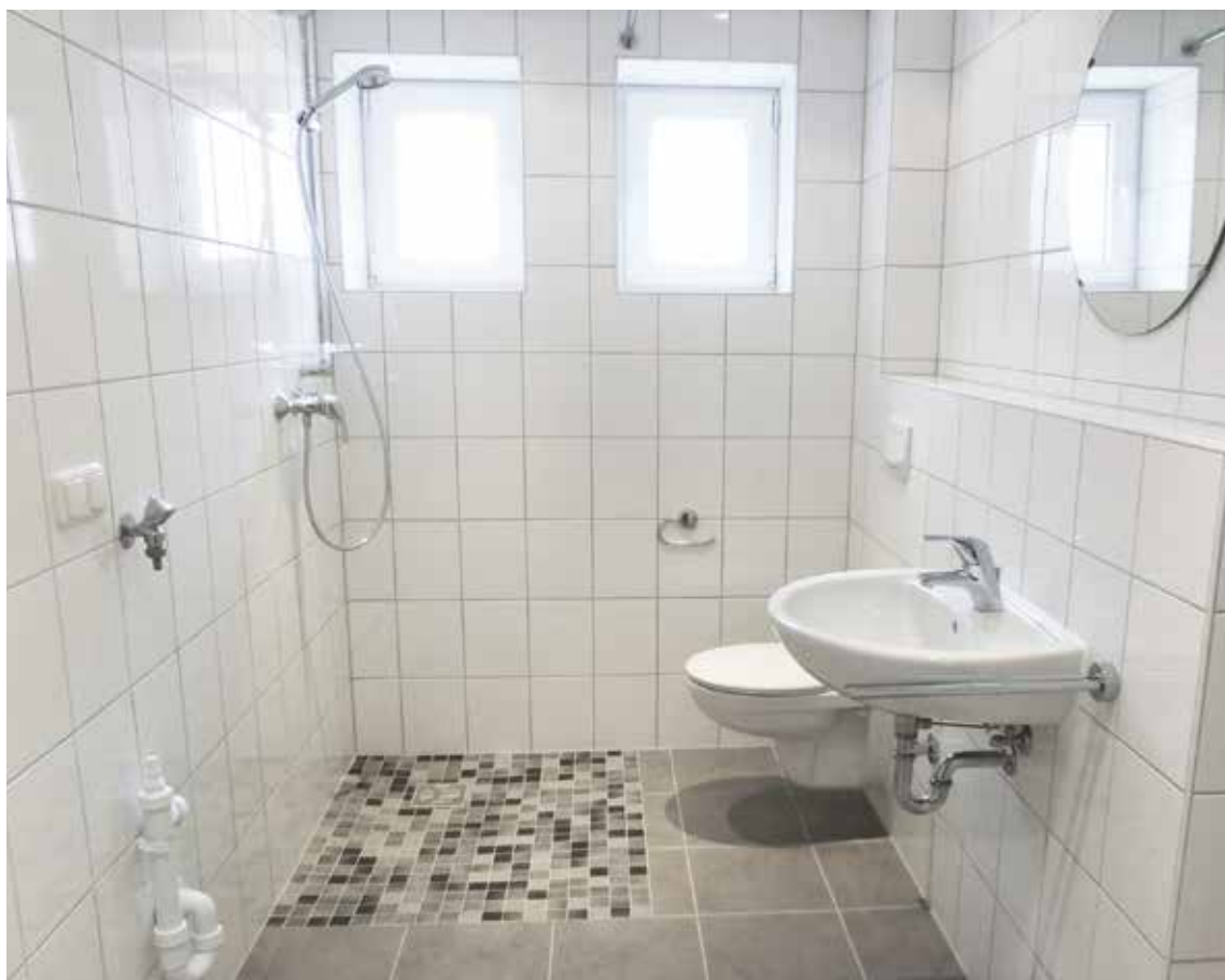
Ebenerdiger Zugang zur Dusche ohne Barriere

Bei Bedarf wird nur der Problembereich saniert, etwa die Badewanne durch eine bodengleiche Dusche ersetzt.