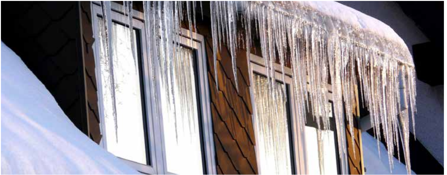
Draußen Winter - drinnen kuschelig und bezahlbar warm

Sobald es im Raum kälter wird, sorgt das Ventil dafür, dass der Heizkörper mehr Wärme abgibt und umgekehrt. Im Kopf des Ventils befindet sich ein Temperaturfühler, der den Zufluss von Heißwasser stoppt, sobald es wärmer wird. Folglich kühlt der Heizkörper ab. Wird die eingestellte Temperatur unterschritten, reagiert der Fühler, und es fließt mehr heißes Wasser in den Heizkörper.